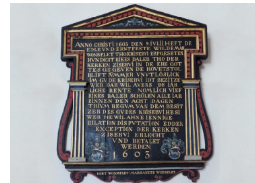
Foto links oben: Gedenktafel für Gefallene aus Sieseby 1848/50; Foto links unten: Segnung der Kinder; Foto rechts unten: Holztafel zu einer Schenkung von 1603

Über der Tür in der Südwand der Kirche hängt eine hölzerne Tafel von 1603, die Auskunft gibt über eine Schenkung von 100 Reichsthalern durch Jost und Margarete Wonsflet, damalige Besitzer des Gutes Krieseby.