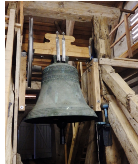
Foto oben links: Stundenglocke von 2016; Foto oben rechts: das Siesebyer Uhrwerk; Foto unten rechts: Siesebyer Glocke von 1899 aus Appolda / Thüringen

Im Zuge der Restaurierung 2015 wurde nach altem Vorbild ein neues Zifferblatt für die Stundenuhr hergestellt und eine Stundenglocke für die Turmuhr gegossen, die im Advent 2016 zum ersten Mal schlug. Neben der Jahreszahl und dem Wappen von Thumburg ist in der neuen, 48 kg schweren Glocke der 16. Vers aus Psalm 31 eingraviert: „Meine Zeit steht in deinen Händen“.